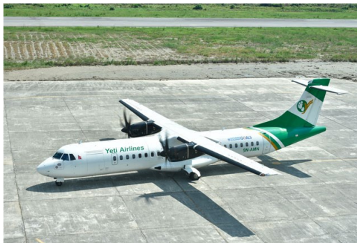
図.1 イエティ航空の事故機と同型機

A: 2023年1月15日、ネパールのイエティ航空 YT691 便 (ATR72-500) がポカ国際空港の滑走路 12 への最終進入段階で墜落しました。ポカ国際空港は本年 1 月 1 日に開港しましたが、同便は以前の空港と間に流れるセリ川の土手に激突して炎上しました。現地の報道によると、パイロットは最初に滑走路 30 への進入を準備した後で滑走路 12 への進入を航空管制に要求したとのこと。同空港の標準計器到着方式 (SIA: Standard Instrument Arrival procedure) によれば、同便は最初に旧空港に設置されている POK VOR をレナル進入位置 (Initial Approach Fix (IAF)) として 087° の方位角 (Heading) で通過した後に、滑走路 12 に向けて右旋回しなければならないことになっています。新空港は旧空港の東南東に位置しています。その日の YT691 の前の便はすべて滑走路 30 に着陸していました。1 月 12 日の YT677 便 (ATR72) だけは、空港の北側を飛んだ後に滑走路 12 に着陸していました。現時点では、搭乗者 72 名のうち 68 名の死亡が確認されています。