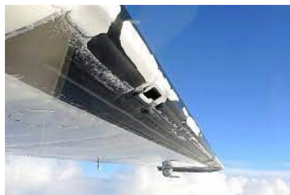
図. 2 ATR72 の主翼前縁の着氷

A: トップダウン思考とは、事象を広い視野と深い洞察力で考えて問題解決を探ることです。広い視野で ATR 社製の機種に注目してみれば、ATR42 シリーズや ATR72 シリーズはこれまで主翼前縁 (Leading Edge) の着氷が原因で何件か失速による墜落事故を起こしていることがわかります。