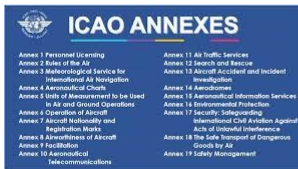
図.1 ICAO Annex 1~19

A: 国際航空法ともいえる ICAO Annex のすべての章の冒頭に「ヒューマンファクターを考慮すること」という内容の規定が追加されています。ですが、わが国の航空界ではその意味がまったくといていいほど理解されていません。弊社は JAL516 便と海保機の滑走路上衝突事故 (Runway Incursion) についていくつかの安全情報を発信しましたが、読者の方々から「誘導路の停止位置の表示や灯火装置はなかったのか？」とか「Runway Incursion を監視するシステムを活用できなかったのか？」といったコメントが多数寄せられています。マスコミに登場しているパイロットの経験者も、「これからは人間ではなく技術でヒューマンエラーを防がなければならない」などとコメントしています。このコメントは、ヒューマンファクターの観点からいえば不適切ではあり、航空安全管理をミズドするものです。今回は、そういう理由についてわかりやすく解説してみたいと思います。なお、弊社代表は「ポリタスTV」という Youtube のテレビ局からこの事故について取材されています。放映はきたる 1 月 13 日 (土) あたりに予定されています。優秀なスタッフが、弊社の安全情報をもとに資料をまとめて下さっています。弊社代表と聡明な女性 MC との対談形式で、Runway Incursion の原因と対策について語り合う予定です。但し、「海保機のパイロットがなぜ管制官の指示を誤解して滑走路に侵入したのか？」という事故原因の核心部分については、あえて解説しない予定です。関係者の責任追及に直接つながる恐れがあるからです。